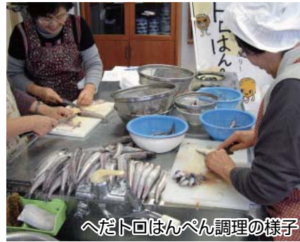
へだトロはんぺん調理の様子

三月二十三日、沼津市の知名度向上や話題づくり貢献した個人団体をたたえる燦々ぬまづ大賞の授賞式が行われ、沼津市商工会戸田支所がみごと受賞しました。深海魚を使ったB級グルメ「へだトロはんぺん」が「期待の新作！燦々デ